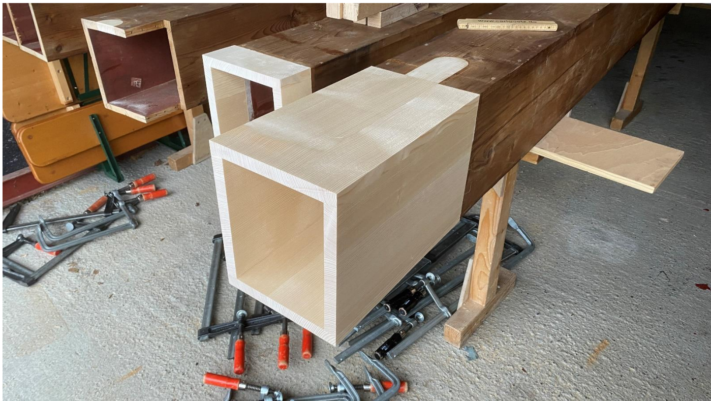
anlängen der zu kurzen Holz Pfeifen des Principalbass 16'