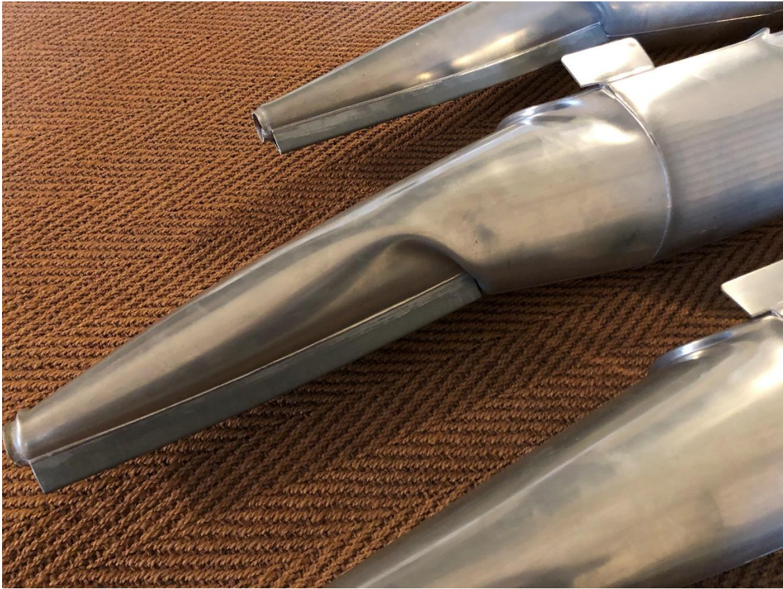
stark deformierte Prospektpipefen – Principalbass 16' G#